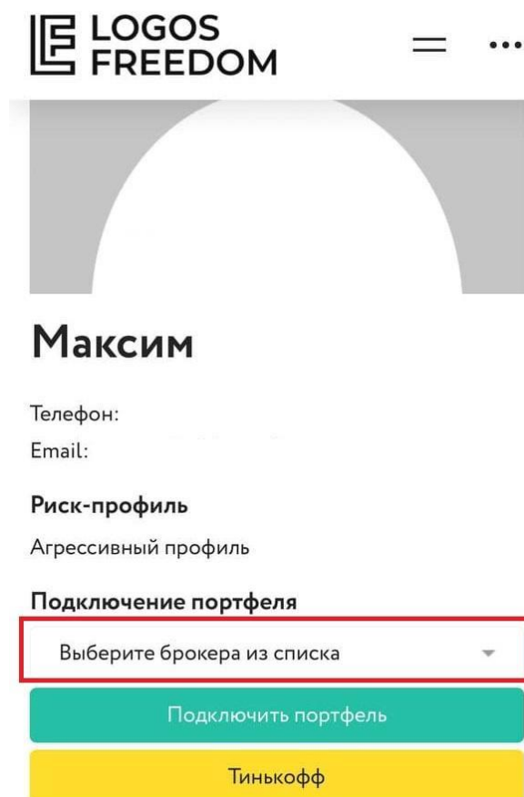
Рисунок 2.2. Подключение портфеля на сайте