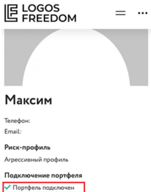
Рисунок 3. Уведомление о подключении портфеля